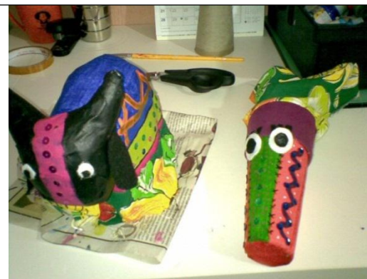
BOI DE MAMÃO E BERNUNÇA