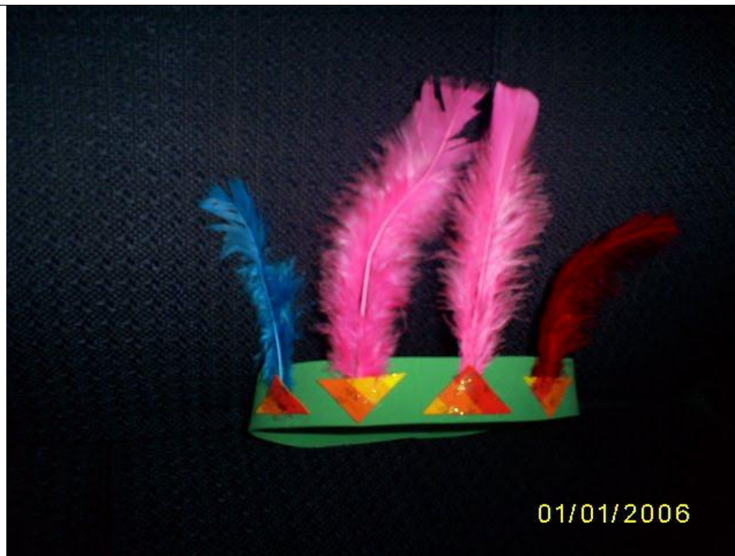
EXEMPLO DE PINTURA INDÍGENA

ATIVIDADES COMPLEMENTARES DE ESTUDO – COVID 19