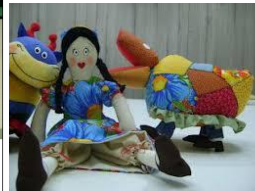
BOI DE MAMÃO, MARICOTA E BERNUNÇA